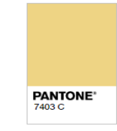
Rejected (Too Light)