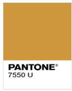
Rejected (Too Dark)