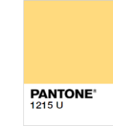
Rejected (Too Light)