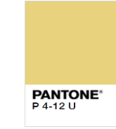
Rejected (Too Light)