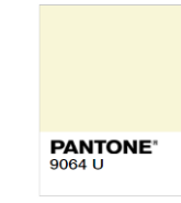
Rejected (Too Light)